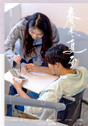
「創意寫作與電影藝術」課程的畢業作品題材豐富，內容細膩感人，甚具欣賞價值。