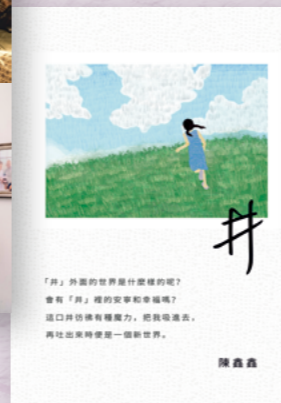
「井」外面的世界是什麼樣的呢？會有「井」裡的安寧和幸福嗎？這口井彷彿有種魔力，把我們帶去，再拉出來時便是一個新世界。