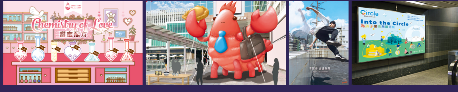
「創意廣告及媒體設計」課程的畢業生以多元手法呈現作品，實在不容錯過。

作為一個寶貴的平台，公開大學創意藝術畢業展將各式各樣的創意藝術匯聚一堂，當中的作品均由「創意廣告及媒體」、「創意寫作與電影藝術」、「動畫及視覺特效」、「電影設計及攝影數碼藝術」及「電腦及互動娛樂」課程的應屆畢業生創作。每件心血結晶背後，展現的不單是同學們的學習成果，更是他們天馬行空的想像。