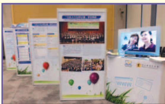
◆「自在人生自學計劃」展示區

The Capacity Building Mileage Programme (CBMP) has been marching to its 10 th Anniversary in 2014. To further promote CBMP and the concept of lifelong learning to the public, the Women's Commission had produced a 6-episode short video series Self-learning with Ease in which students shared with us,