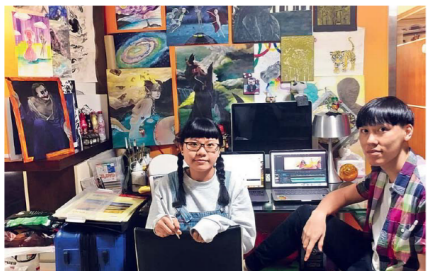
都大積極推廣全日制課程，其中創意藝術課程不但備受莘莘學子歡迎，教學團隊中不乏業界精英，培育不少優秀學生。

「不少畢業生反映在求職期間，遇到僱主仍誤以為公大是只開設兼讀制課程或提供遙距教育的大學。」黃主席坦言，雖然校方一直致力透過不同渠道作出澄清，惟校名深入人心，令類似的情況不時發生。