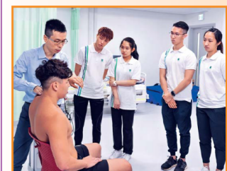
最新落成的賽馬會健康護理學院內特設物理治療教研室，助學生掌握行業最新知識及技能。