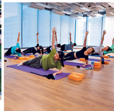
都大設有功能訓練室，讓學生們可進行瑜伽、空中瑜伽、普拉提、全身阻力運動及徒手運動訓練課程。

展以至就業及創業的機會，再決定未來的發展路向。」林校長稱，本港大學的辦學經驗及國際化管理制度，亦值得與內地同業分享，加上主要科目以英語授課，對有志開拓國際視野的內地學生尤為合適，也可達至優勢互補的效果。