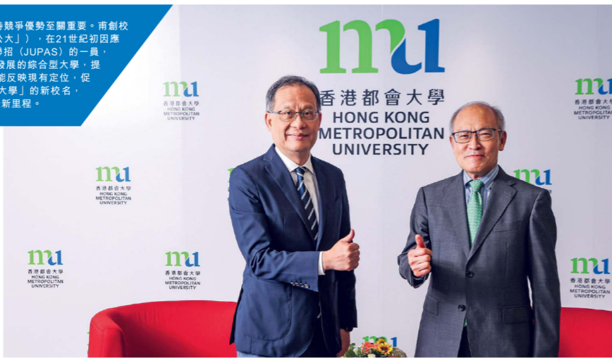
香港公開大學由今日起改名為「香港都會大學」，代表大學步入全新里程。