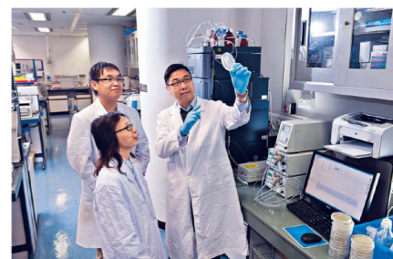
隨著大學近年在研究範疇屢創佳績，林校長指都大將設立研究影響基金，繼續推動研究發展。

由公大過渡至都大，林校長形容，這是一所很特別的大學，全港只此一家，在全日制課程及遙距課程共同推廣下，以多元學習模式為各個進修社群提供機會，在進修階梯拾級而上。「未來我會聯同校董會及一眾教職員共同努力，令都大更現代化、更優良，為香港社會作出更多貢獻。」