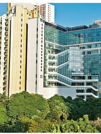
▲配合大學發展，校方積極改善校園設施，圖為最新落成的賽馬會健康護理學院。

校名校徽意義深遠 為此，校方在兩年前藉大學成立三十周年紀念的契機，展開諮詢工作，廣泛收集教職員、學生和校友及其他不同持份者對更改校名的意見，並公開徵集新校名的提名。黃主席憶述：「我們收到逾千個提名，部分提名相當有趣，經過嚴格的遴選程序，最後通過採用「香港都會大學」作為新校名。」