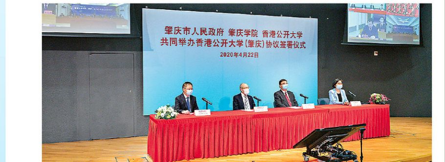
▲校方與肇慶市人民政府及肇慶學院簽署協議

粵港澳大灣區是國家重點發展策略，教育是其中一個重要的發展範疇，香港擁有一流高等學院，其豐富的辦學和教育經驗，可為推動區內高等教育發展作貢獻。公大於2020年4月與肇慶市人民政府及肇慶學院簽署協議，三方共同籌辦香港公開大學（肇慶），作為推動區內高等教育發展的基地，有關計劃正待國家教育部審批。配合大學易名，公大（肇慶）亦會取名為香港都會大學（肇慶）。 引進成功經驗 計劃中，都大（肇慶）是一所教學與研究相結合的應用型大學，其辦學方針將貫徹香港都會大學的理念，並同時引入都大優質教育資源和教學質量保證體系。黃主席表示，都大在肇慶開辦新校，可以將本地大學的辦學經驗、國際化元素和完善管理制度帶入大灣區，跟區內高等院校和教育機構分享，促進彼此的交流與聯繫。 校企合作 與市場接軌 除了培養人才，都大（肇慶）亦會積極聯繫區內企業，開展合作。林校長指，大學可藉此吸納更多資源支援研究，同時收集市場資訊，了解市場的需要；另一方面可將研究成果介紹給不同企業，通過技術轉移，推動科研成果給不同企業，通過技術轉移，推動科研成果給不同企業，通過技術轉移，推動科研成果給不同企業。