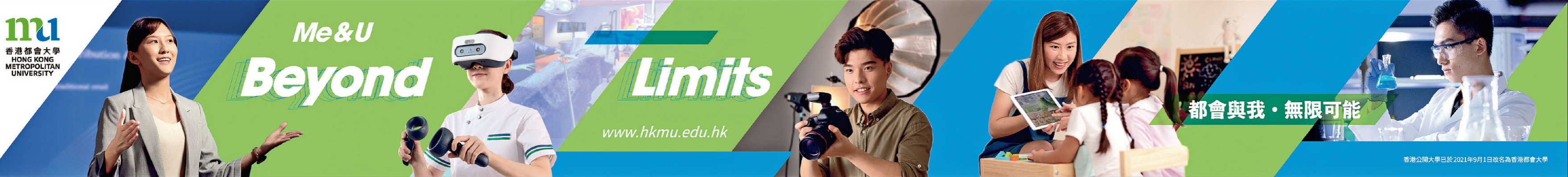
香港公開大學已於2021年9月1日改名為香港都會大學