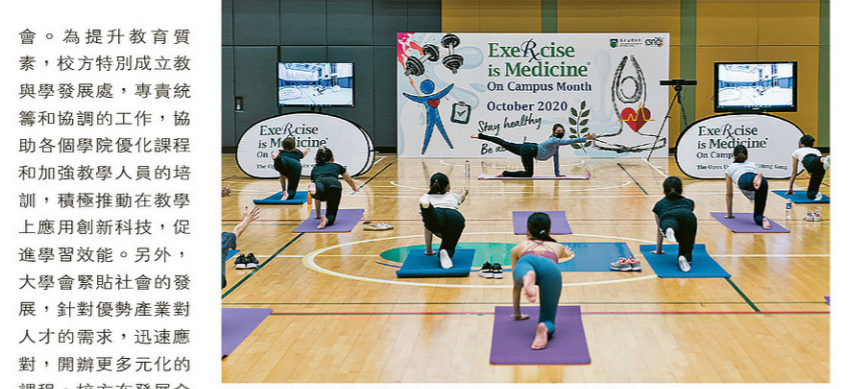
▲校方積極舉辦不同類型的課外活動，豐富學生的校園生活。

會。為提升教育質素，校方特別成立教學發展處，專責統籌和協調的工作，協助各個學院優化課程和加強教學人員的培訓，積極推動在教學上應用創新科技，促進學習效能。另外，大學會緊貼社會的發展，針對優勢產業對人才的需求，迅速應對，開辦更多元化的課程。校方在發展全日制授課課程的同時，將繼續營辦遠距教育，成立「公開進修學院」，將遠距課程納入統籌處理，貫徹雙軌並行的方針。 黃主席補充說，校方今後亦將加強通識教育，鼓勵學生涉獵不同範疇的知識，擴闊個人知識層面之餘，發展不同的興趣和嗜好，豐富人生。課堂以外，舉辦更多不同類型的活動讓學生參加，促進他們其他方面的發展，同時營造更多姿多采的校園生活。 留住人才 構建優秀教學團隊 林校長形容，都大擁有優秀的專業教學團隊，不但熱心教學，在教研兩方面均有出色表現。然而，作為自資大學，該校或未能於短期內提供類似政府資助大學的終身教師制度，怎樣留住優秀教學人員將會是他今後其中一項要面對的挑戰。另外，他將會跟各學院院長協調和溝通，共同訂立發展指標，給予教學人員更清晰明確的目標和方向，攜手推動大學的發展更上一層樓。