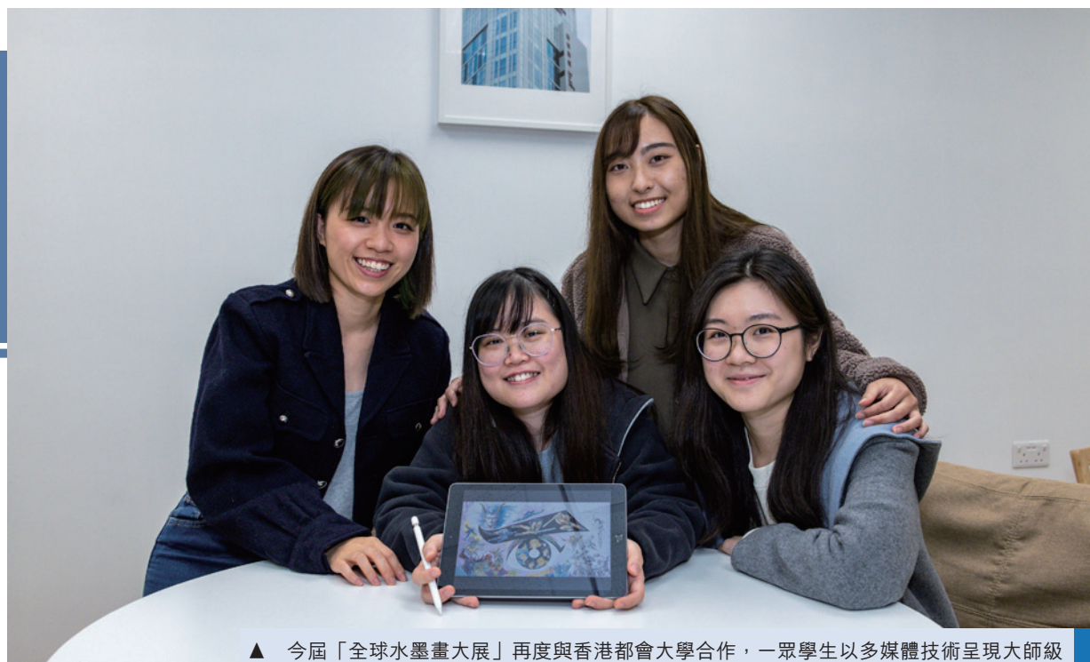
▲ 今屆「全球水墨畫大展」再度與香港都會大學合作，一眾學生以多媒體技術呈現大師級作品。