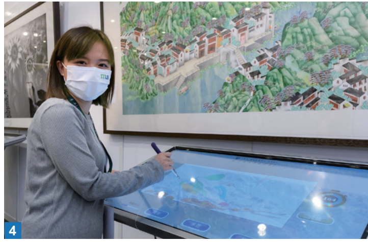
3 在展覽開幕禮向特首林鄭月娥示範數碼水墨筆觸填色。

作體驗，「水墨畫屬傳統的繪畫形式，但今次的創作把水墨畫數碼化，透過電子媒介呈現出來，又能與公眾互動，體驗水墨藝術創作。」她表示，以往賞畫只會留意畫作的構圖，但今次的導師的指導下，令她對創作的含意及背後的訊息有更深入的了解，使她獲益不少，提升了她欣賞藝術的能力。