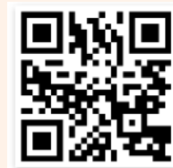
「網上報名教學」短片