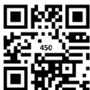
全費報讀學費 港幣 450 元*