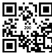
獲資助後學費 港幣 200 元*