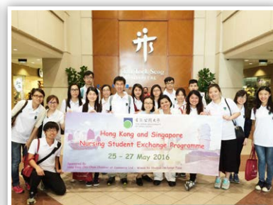
新加坡護理交流團