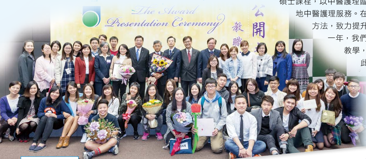
公開大學教職禮讚

護 理及健康學部成立至今，經歷種種變遷與革新，旨在為本港護理專才的培訓打下結實基礎。作為自資院校，我們因應社會需要，靈活開辦各類護理學課程，例如於2012年開辦健康學文憑（社區健康護理），並配合政府的醫療政策，加強社區護理服務的支援。此外，去年開辦的護理學碩士（中醫護理）是全港首個培訓中醫護士的碩士課程，以中醫護理臨床專科化作為目標，開拓本地中醫護理服務。在教學上，我們也不斷引進新方法，致力提升教與學的質素與效能。過去一年，我們於課堂之中啟用了虛擬實境教學，實為本港護理教育先驅。凡此種種皆是本學部為實現「致力成為提供靈活護理及衛生保健教育的先驅」這一願景所付出努力的里程碑，繼續為香港培育專業護理人才出一分力。