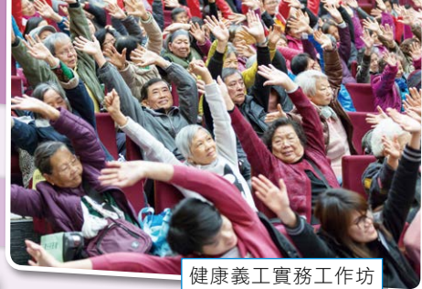
健康義工實務工作坊 之齊做「長者椅上操」