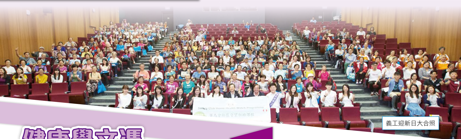
義工迎新日大合照

承 蒙香港賽馬會慈善信託基金贊助，本學部自 2014 年起開展「賽馬會社區守望相助課程」。至今，合作的社福機構及義工團體共 19 個，共培訓了六百多位社區健康義工，以增強社區健康服務的支援。第二屆課程的「義工迎新日」已於去年 10 月假銀禧學院賽馬會綜藝廳舉行，社區健康義工接受培訓後，可為社區上有需要的長者、殘疾人士、慢性病患者等提供適時的健康支援及照顧。本學部 62 位護理學校友更義務擔任「社區健康大使」，以其專業知識及臨床經驗協助培訓義工，回饋社會。有關課程資訊見網站 http://hwh.ouhk.edu.hk 。