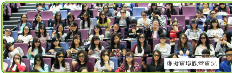
虛擬實境課堂實況