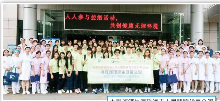
本學部師生跟珠海市人民醫院代表合照