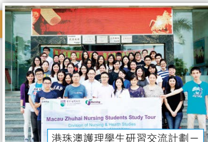
港珠澳護理學生研習交流計劃—與遵義醫學院教職員合照