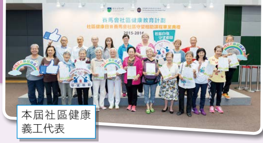
本屆社區健康義工代表