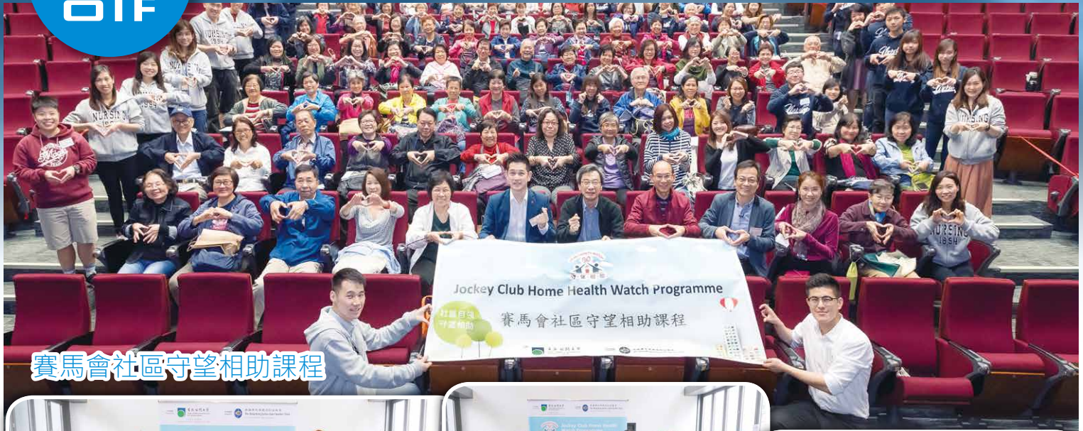
賽馬會社區守望相助課程