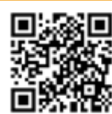
護理學碩士 (中醫護理) 課程